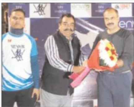
मुख्य अतिथि का स्वागत करते हुए।