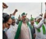
Bhartiya Kisan Union leader Rakesh Tikait