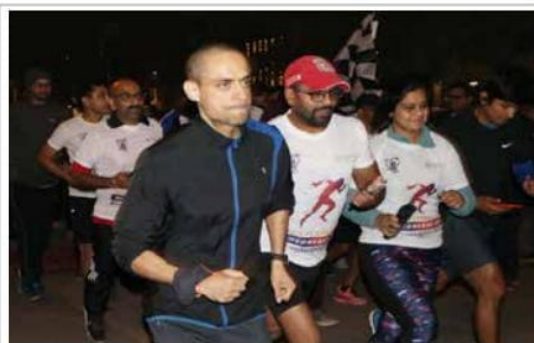
गुरुग्राम में मिल्खा सिंह की जयंती पर आधी रात को हुई मैराथन में भाग लेते लोग।

गुड़गांव टुडे, गुरुग्राम। फ्लाइंग सिख स्वर्गीय मिल्खा सिंह की जयंती पर शुक्रवार की आधी रात को आयोजित की गई मिड नाइट रन में लोग खूब दौड़े। वाटिका ग्रुप की सुविधा प्रबंधन शाखा एनवायरो के वाटिका इंडिया नेक्स्ट में इस मैराथन का आयोजन किया गया।