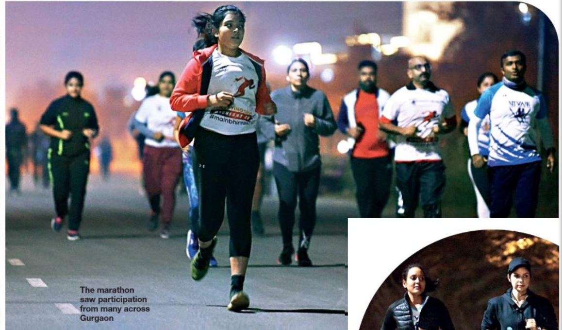
The marathon saw participation from many across Gurgaon