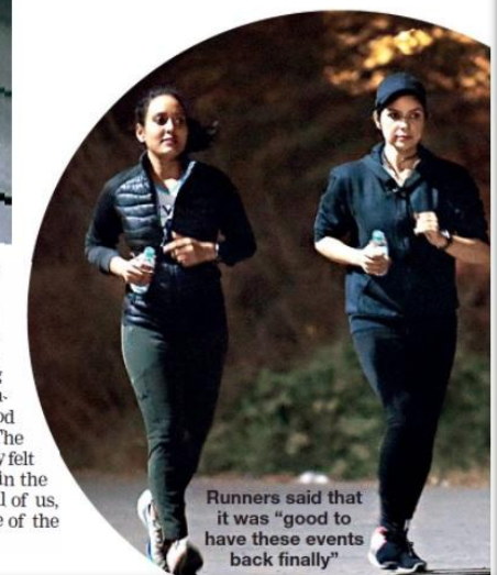
Runners said that it was "good to have these events back finally"

Running events – even late-night ones – had been common in the Millennium City before the pandemic. As they now restart, the running community says they have been eagerly awaiting their return. "It's good to have these events back finally. The absence of running events in the city felt like such a void. Plus, this one is in the memory of a man who inspired all of us, which makes it extra special," one of the participants told us.