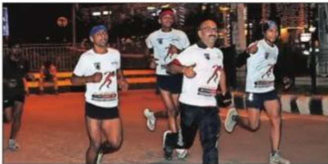
‘द फ्लाईंग सिख मिडनाइट रन’ में भाग लेते धावक।

मध्यरात्रि में 12 बजे शुरू हुई मैराथन में धावकों को विभिन्न श्रेणियों (5 किमी, 10 किमी, 21 किमी, 36 किमी) में प्रतिस्पर्धा करते देखा गया। एनवायरो ने इसे ‘धावक’ संस्था के सहयोग से आयोजित किया। चार घंटे लंबी ग्रैंड मैराथन दौड़ वाटिका टाउन स्क्वायर सेक्टर-