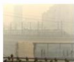
Smog in Gurugram