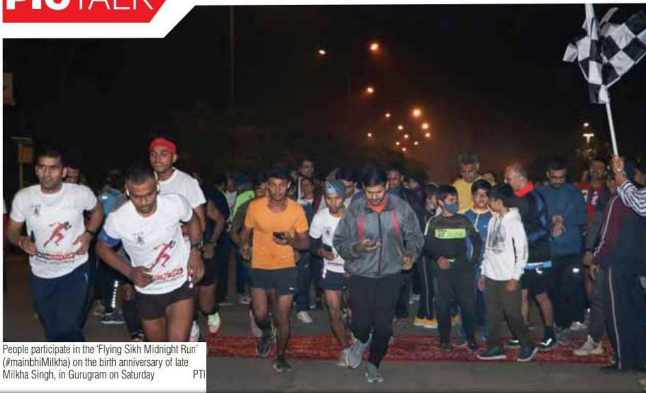
People participate in the 'Flying Sikh Midnight Run' (#mainbhiMilkha) on the birth anniversary of late Milkha Singh, in Gurugram on Saturday