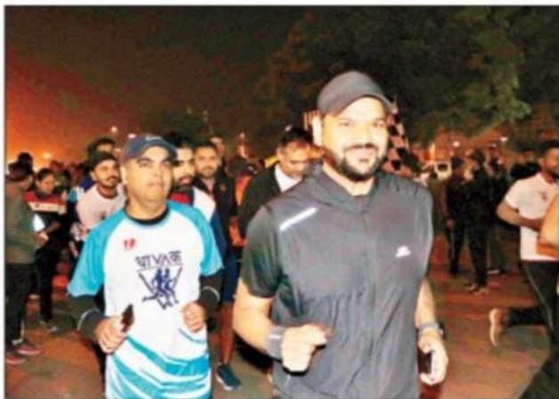
मिल्खा की याद में दौड़ते गुड़गांववासी।