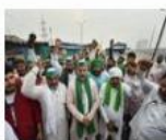
Bhartiya Kisan Union leader Rakesh Tikait