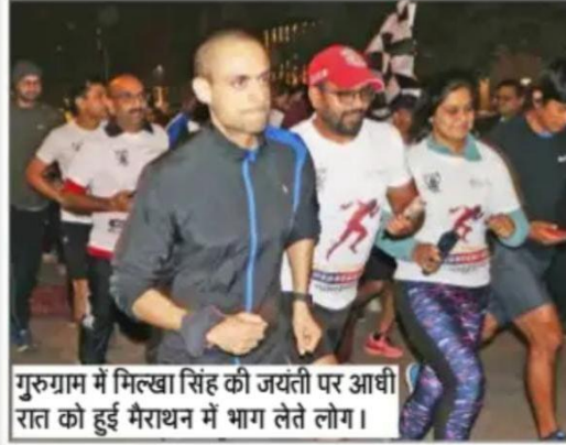
गुरुग्राम में मिल्खा सिंह की जयंती पर आधी रात को हुई मैराथन में भाग लेते लोग।