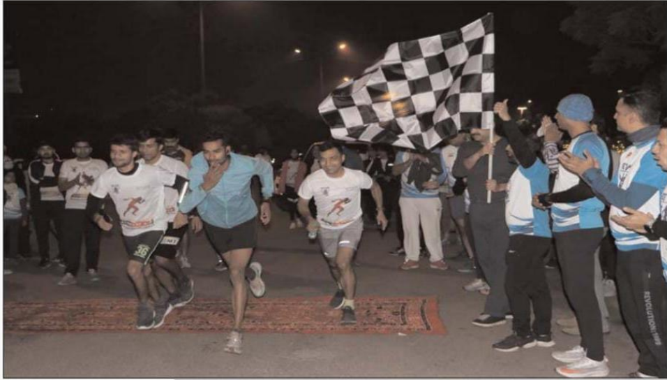
आज तक गुडगांव