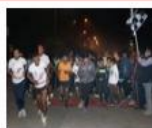
The Flying Sikh Midnight Run