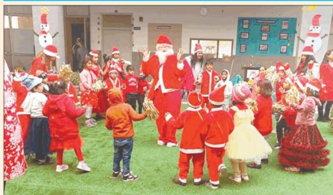
स्कूल में आयोजित कार्यक्रम के दौरान धमाल मचाते हुए बच्चे।

सोहना, 25 दिसम्बर (रा): वेदास इंटरनेशनल स्कूल में लाल और सफेद वस्त्रों से सुसज्जित छात्रों ने क्रिसमस का उत्सव बड़े उत्साह और खुशी के साथ मनाया। कक्षा 9 के प्रिंस व प्रिंसिपल ने कार्यक्रम का संचालन करते हुए यूथूनसीस के बारे में बताया। विद्यालय की संचालिका, प्रधानाचार्या तथा सभी अध्यापिकाएँ भी एक्ट और लाल रंग के वस्त्रों से सजावटी थी। उत्सव का प्रारंभ विद्या की धमकी और सरस्वती की वंदना से हुआ। जिसे कक्षा 4, 5, 6 की छात्राओं ने बड़े ही मनमोहक शालीन नृत्य द्वारा प्रस्तुत किया, वहीं कक्षा नर्सरी, एलकेजी, यूकेजी के बच्चों ने क्रिजल बेल की धुन पर नृत्य कर सभी का मन मोह लिया वहीं, इसके बाद कक्षा 1, 2, 3 के छात्रों ने भी फेसी वस्त्रों में एक एक्साइटिंग नृत्य कर सभी को मोहित कर दिया यह कार्यक्रम प्रातः 9 बजे से दोपहर 1 बजे तक चला।