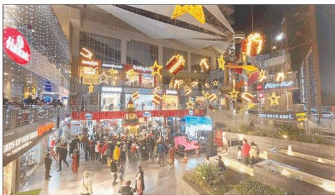
कई जगहों पर की गई बेहतरीन सजावट

गुडगांव, 25 दिसम्बर (ब्यूरो): साल 2022 खत्म होने के कगार पर अब 2023 का इंतजार है। ऐसे में क्रिसमस साल का सबसे आखिरी माह होता है। जिसे पूरे शहर में बड़ी धूमधाम से मनाया जा रहा है।