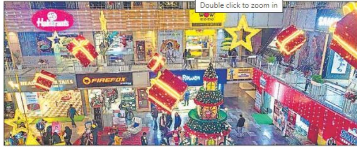
कुं कुं कुं के कुं कुं कुं कुं • हिन्दुस्तान

कल जश्न मनेगा : सेक्टर-84 के अल्फा कॉर्प का गुडगांव वन सोसाइटी में 25 दिसंबर को क्रिसमस का जश्न मनाया जाएगा। जहां बच्चों की खुशी और हंसी देखने लायक होगी। चमकोले नीले आकाश के खिलाफ रंगीन सजावट के साथ निवासी