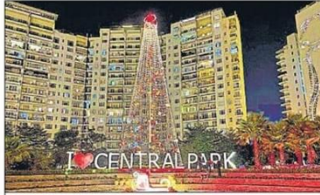
गुरुग्राम के सोहना रोड स्थित सेंट्रल पार्क रिसॉर्ट्स में दिल्ली-एनसीआर का सबसे ऊंचा क्रिसमस ट्री स्थापित किया।